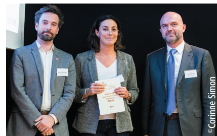
jho - Award de l'innovation altruiste et Award du Public

scolaires la transmission de repères culturels et humanistes et des codes de notre pays afin que les enfants puissent trouver leur place dans la société, et grandir en confiance avec l'envie de réussir ».